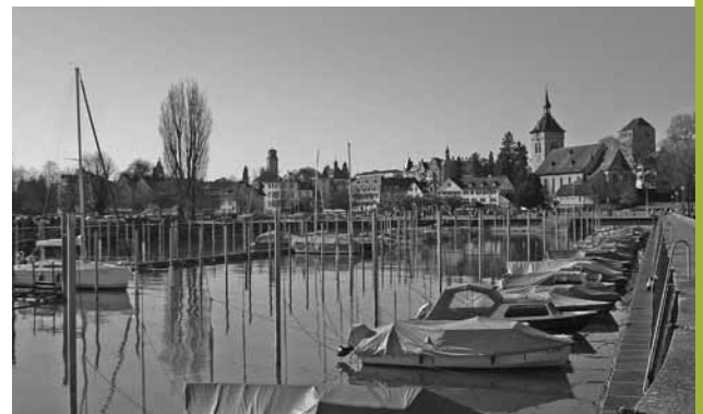
Romantischer Arboner Hafen – doch an den neuen Planken scheiden sich die Geister.

WIE MACHEN SIES ? Dennoch bleibt die Frage offen: Ist es ökologisch und volkswirtschaftlich sinnvoller, einheimische Eiche zu verwenden, die nach 30 Jahren ersetzt werden muss? Oder ist das Vertrauen in die FSC-Zertifizierung gerechtfertigt und ist es womöglich sogar wichtig, solche Exporte zu stärken, um der nachhaltigen Waldwirtschaft in Schwellen- und Entwicklungsländern zum Durchbruch zu verhelfen? Gerne nehmen wir Ihre Meinungsäußerung entgegen, wie Sie in Ihrer Gemeinde bei ähnlichen Situationen umgehen. ☛